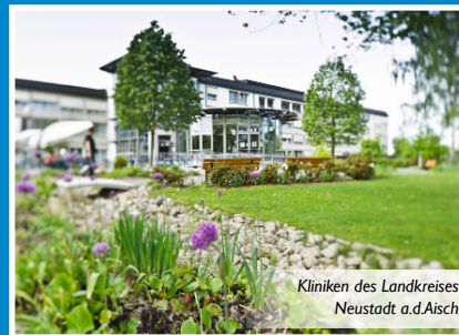
Kliniken des Landkreises Neustadt a.d.Aisch