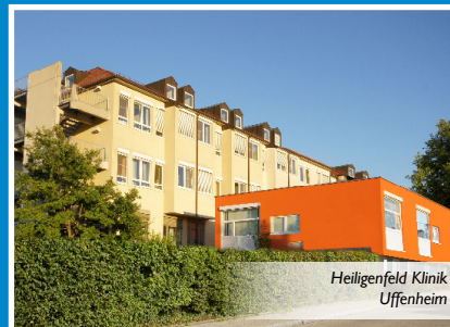
Heiligenfeld Klinik Uffenheim

Unser Landkreis Neustadt a.d.Aisch-Bad Windsheim hat in vielerlei Hinsicht MEHR im Angebot.