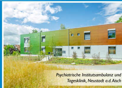
Psychiatrische Institutsambulanz und Tagesklinik, Neustadt a.d.Aisch