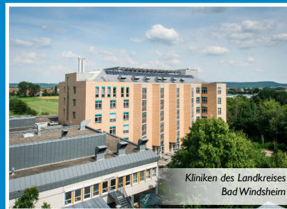
Kliniken des Landkreises Bad Windsheim